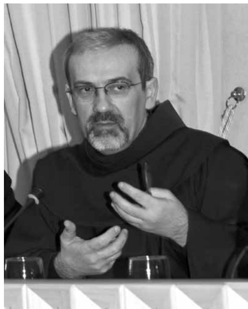
Padre Pier Battista Pizzaballa Custode di Terra Santa