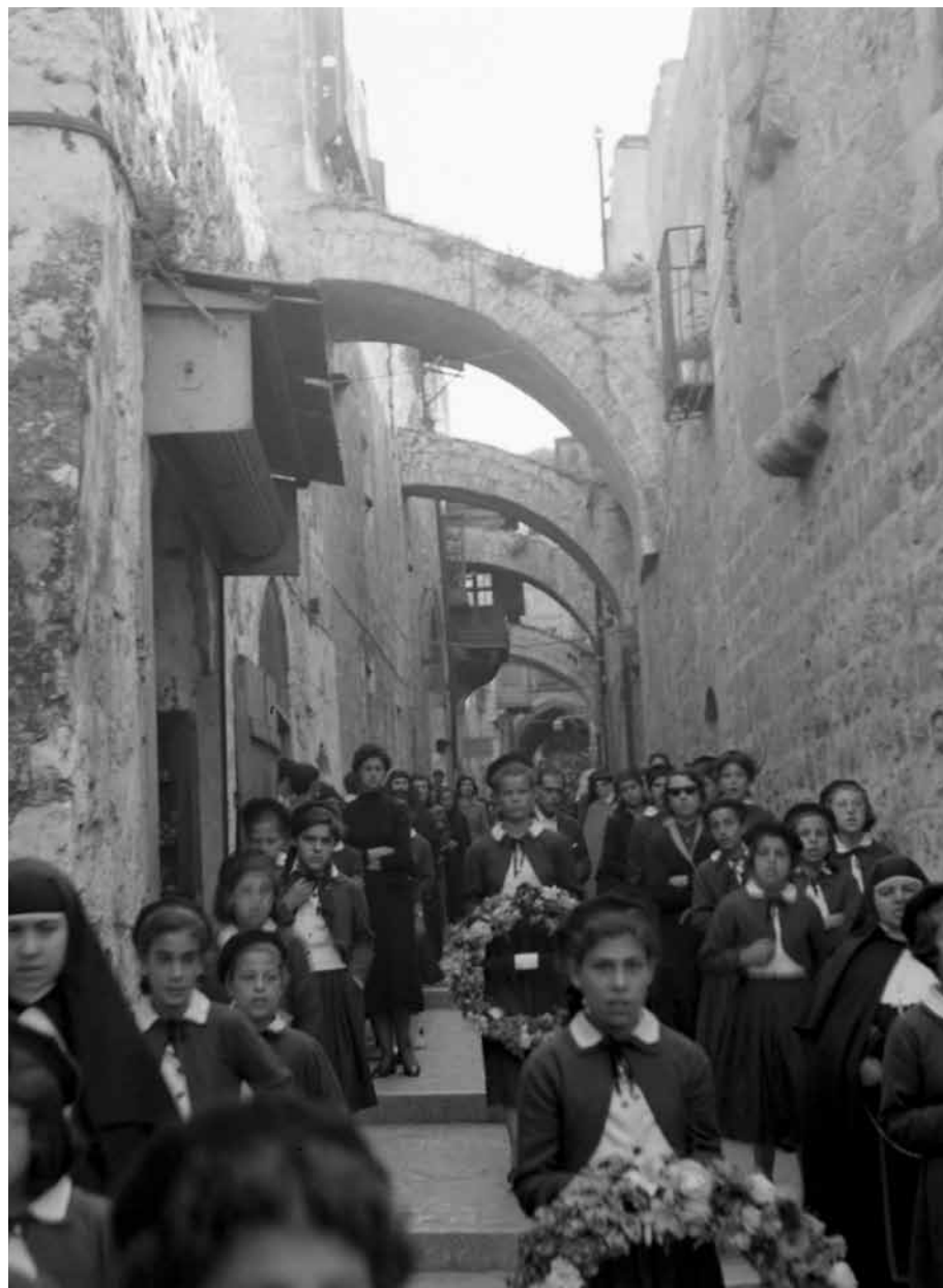
Processione lungo le vie di Gerusalemme