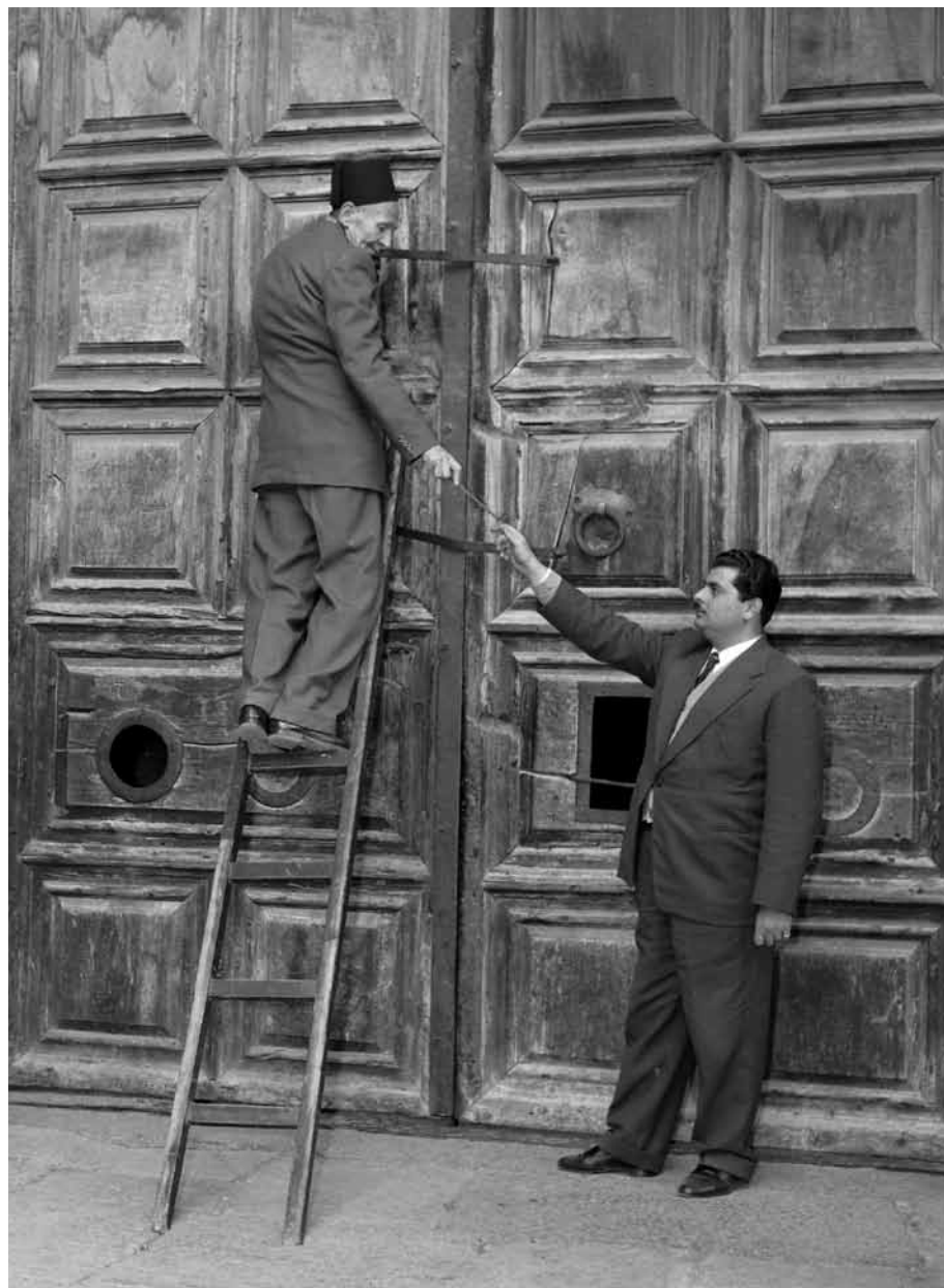
Portale del Santo Sepolcro