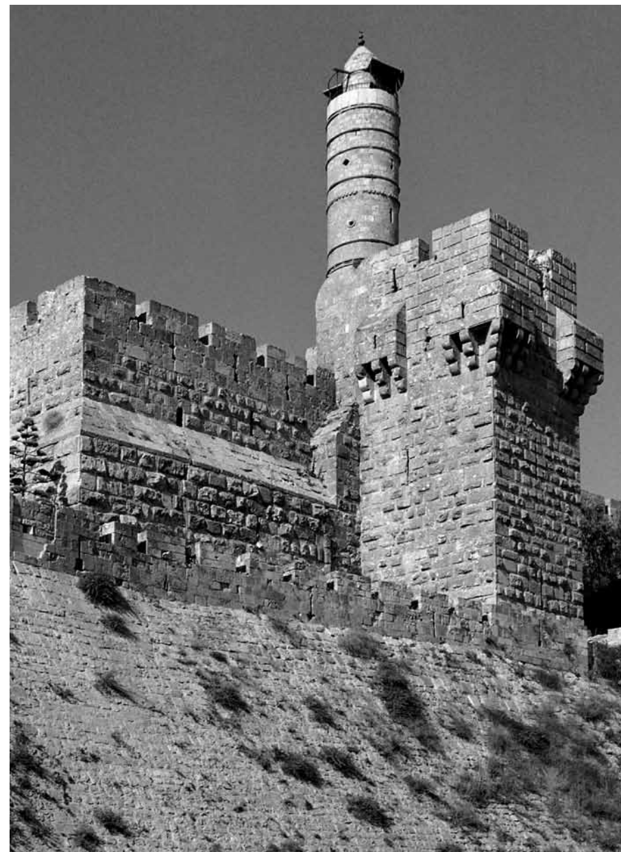
Cittadella - torre di Davide