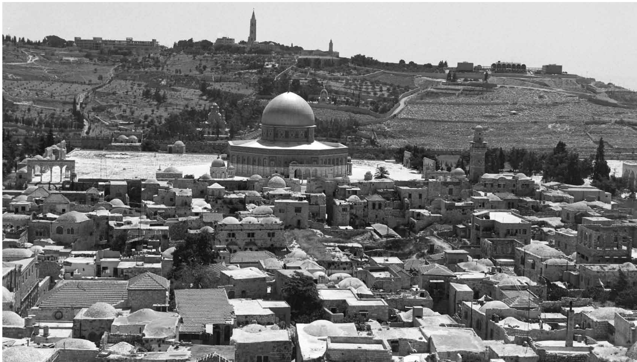
Spianata delle moschee con il quartiere arabo demolito dopo la guerra del 1967