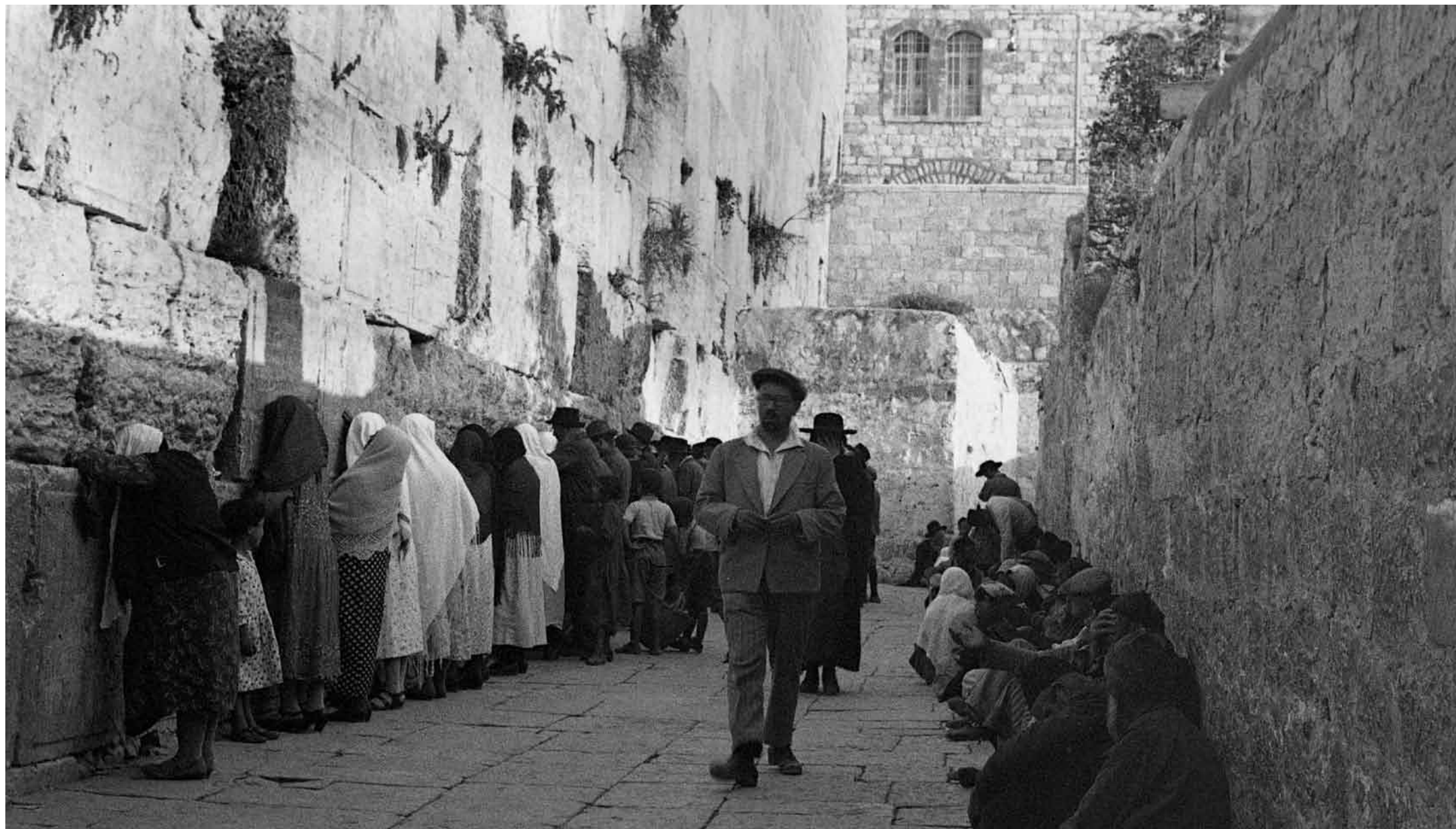
Muro occidentale prima del 1967