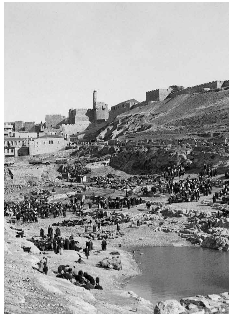
Mura occidentali della città vecchia