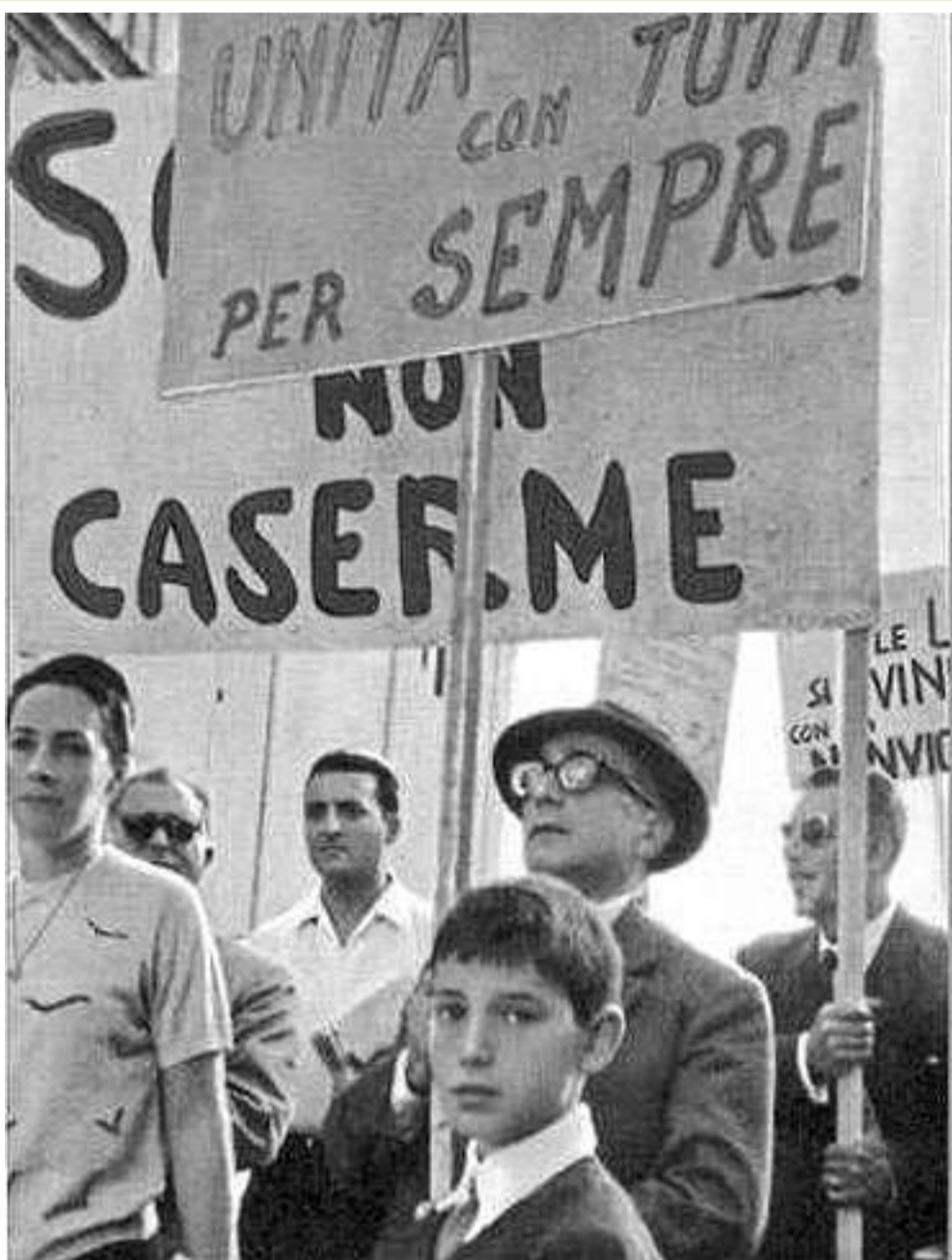
Claudio Capitini, al centro, con gli occhiali, alla prima marcia della pace Perugia-Assisi, il 24 settembre 1961

Dopo la fondazione dell'Associazione per la difesa e lo sviluppo della scuola pubblica italiana, lesse Esperienze Pastorali , pubblicate nell'aprile 1958, di don Milani, definendole «il più bel libro che ci abbia dato un cattolico italiano in questo secolo». Un giudizio analogo su quel libro l'aveva dato uno statista autorevole come Luigi Einaudi. Capitini però — che pure si incontrò più volte con don Milani e collaborò con lui per un Giornale